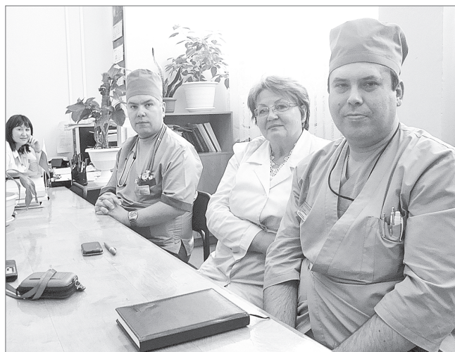
Во время видеоконференции

Известно, что наша медсанчасть оказывает медицинскую помощь примерно 60 тысячам взрослых се-