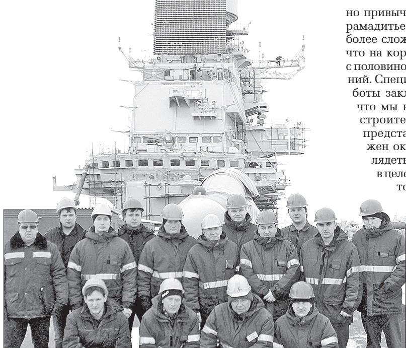
Без конструкторов на корабле не обойтись

Отдел компоновки помещений в проектно-конструкторском бюро Севмаша – подразделение из редкой категории: в своём роде оно единственное и неповторимое. Конструкторов, работающих здесь, величают ёмким и ко многому обязывающим словосочетанием – «хозяева помещений».