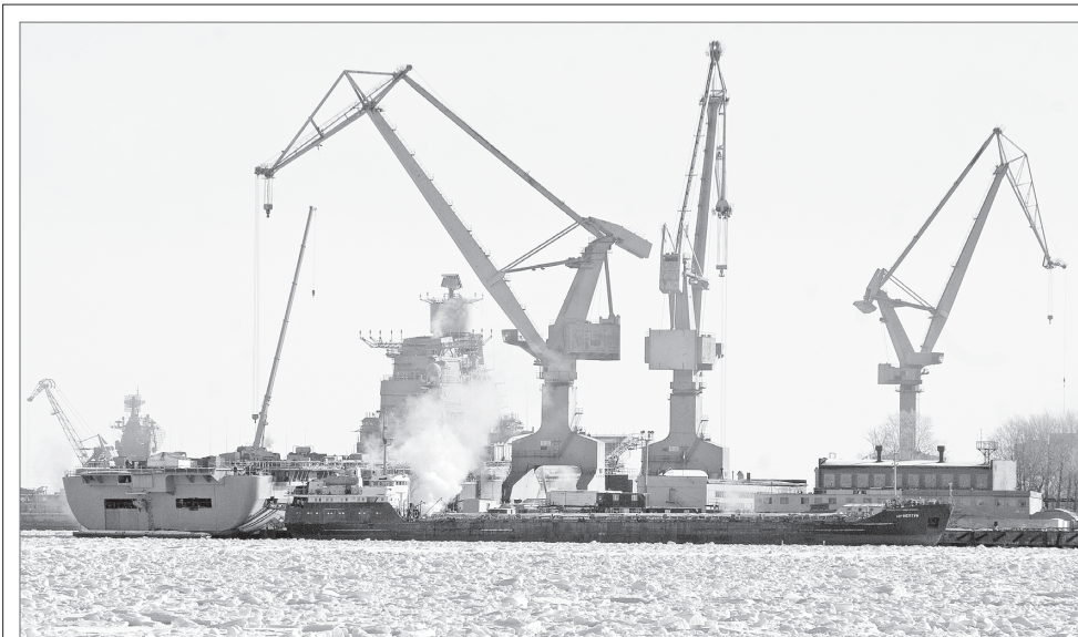
Танкер «Нептун» заправил авианосец